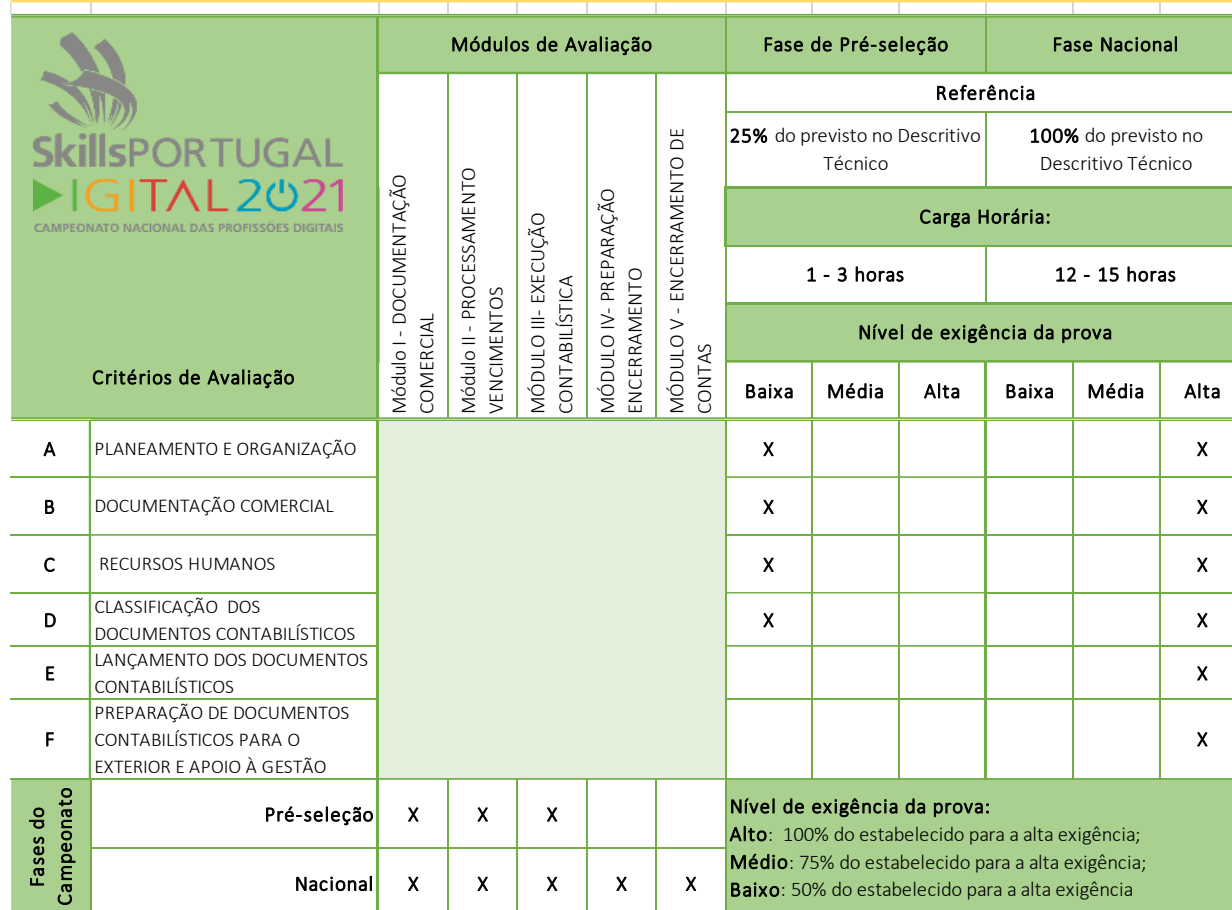
Quadro correspondência de Critérios de Avaliação | Módulos | Fases do Campeonato